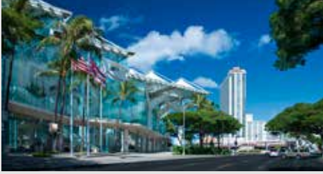
Honolulu, Hawaii, ABD, 6-10 Haziran 2020