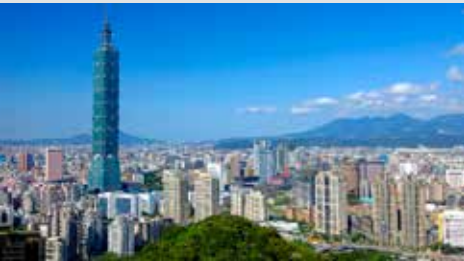
Taipei, Taiwan, 12 - 16 Haziran 2021