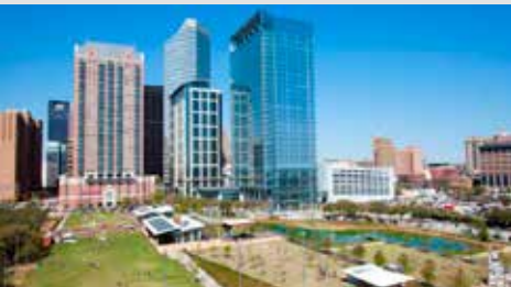
Houston ABD, 4-8 Haziran 2022