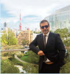
Av. Suat Şimşek Kasım 2019

Japonya, 6852 adadan oluşan bir takımadalar grubu olarak ifade edilir ki; Tokyo'da başkent olarak bu adalardan en büyüğü ve Ana Ada olarak bilinen Honşu'nun üzerine kurulmuştur.