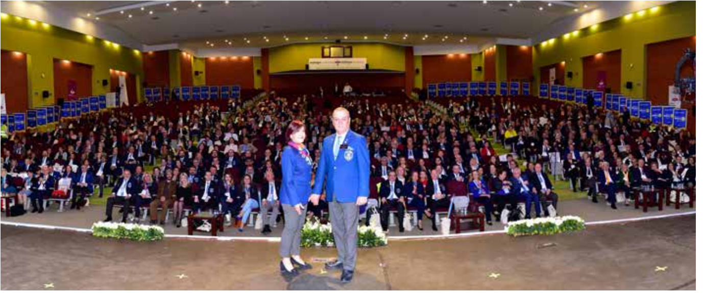
2420 Bölgenin Asamble ve BES'i çok geniş bir katılımıla Maltepe Üniversitesi Konferans salonunda gerçekleşti

zı yiyelim, sınıflarımızda Rotary bilgilerimizi tazeleyelim” sloganı ile davet edildi