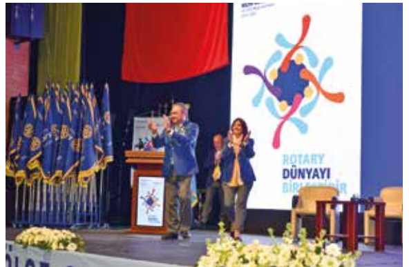
2420. Bölge 2019-2020 Dönem Guvernörü ve eşi

Bu örnek Bölge Eğitim Asamblesini başarılı bir şekilde gerçekleştiren İstanbul-Şişli Rotary ve Rotaract Kulüplerini, gelecek dönem Bölge Ekibini, Eğitimcileri ve katılımcı tüm Rotaryenleri kutluyoruz. Yolları açık olsun.