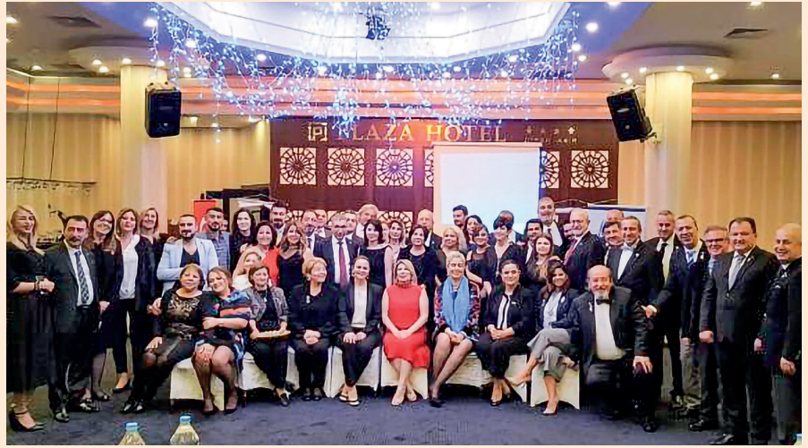
2430. Bölgede Rotary her alanda büyüdü. Kulüp ve üye sayısı arttı. Gençler ve kadınların üye sayısı arttığı gibi 29 yaş altı üyelerin sayısı da 29'dan 80'e yükseldi.

Bütün bu çalışmalara ek olarak, geçmişte var olduğumuz fakat bugün olmadığı illerde yeniden kulüp kurma çalışmaları başlattık; çeşitli nedenlerle kapanmış olan iki kulübümüzün olduğu Diyarbakır ilinde, dönemi-