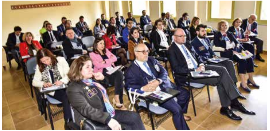
Bölge asamblesinde eğitim 13 ayrı sınıfta 60'şar kişilik gruplara verildi

labalık Asamblesi gerçekleşti ve 917 kişilik bir Asamble kaydı oluştu.