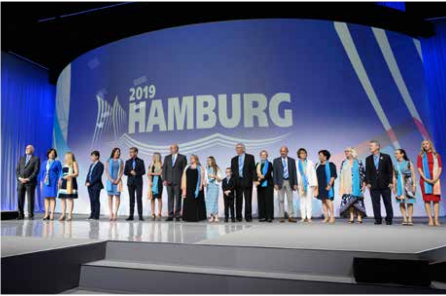
Uluslararası Rotary'nin Hamburg Konvansiyonu açılış seremonisi - 2 Haziran 2019. Barry Rassin ve eşi Esther sahneye beraber geldiler. Başkan Rassin konuşmasında Rotary'deki değişimden bahsetti