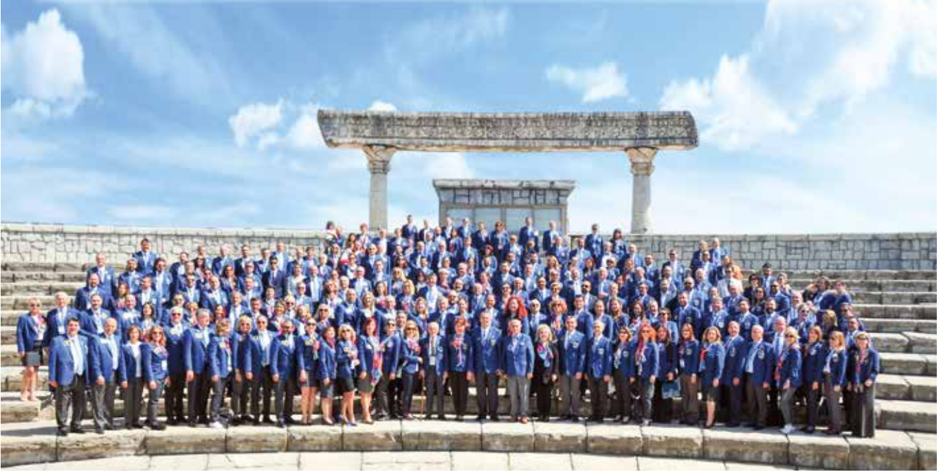
2430. Bölgenin Antalya Belek'te yapılan BES ve asamblesi 856 kişilik bir katılım ile gerçekleşti