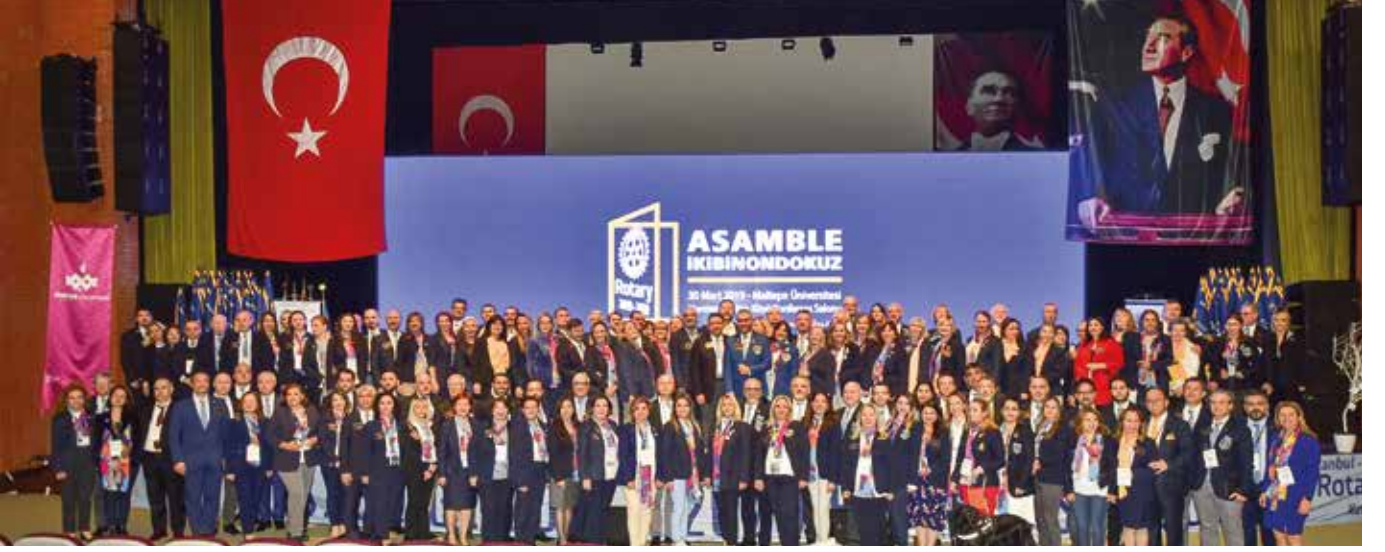
2420. Bölgenin Asamblesi rekor sayıda katılımla gerçekleşti. 60'ar kişilik 13 ayrı sınıfta yapılan asambleye 917 kişi kayıt yaptırdı.