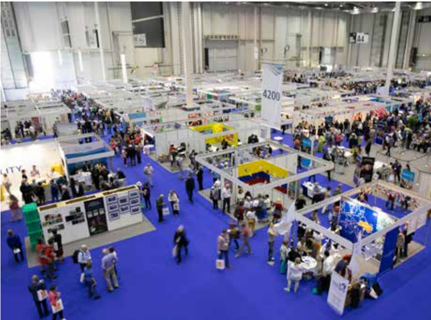
Fuar alanında iki salonu dolduran Dostluk Evinde 334 teşhir standı yer aldı ve bunların 200'tanesi Rotary projelerinin tanıtımını içeriyordu

zi arasında, gerekse de şehrin muhtelif istikametlerine ulaşan metrosu ve otobüs sistemi ile Konvansiyona katılanların rahat bir şekilde istedikleri yere kolayca ulaşmalarını sağladı. Ayrıca oldukça düz bir alanda yerleşik olması sebebiyle de bir çok kişi de bisiklet sistemini kullandı.