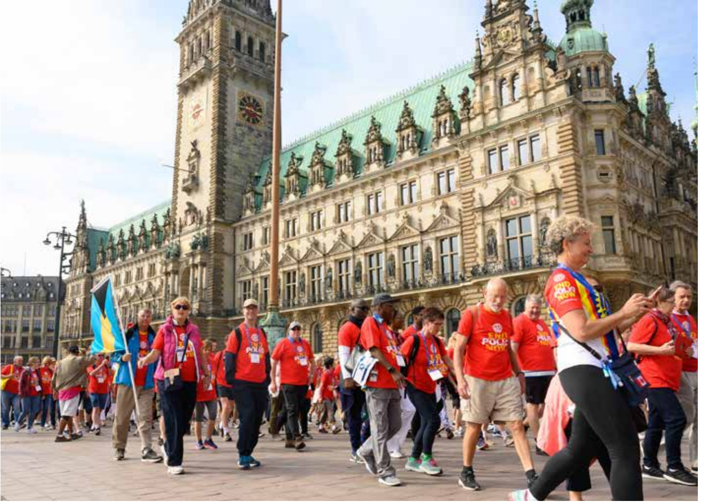
Konvansiyon ile beraber, Hamburg şehrinde Rotary'nin ve programlarının da tanıtımı yapıldı. Resimde Hamburg Belediyesi önünde "Çocuk Felcine Son" tişörtleri giymiş olan Rotaryenlerin geçit töreni görülüyor.

U luslararası Rotary'nin bir döneminin zirvesi olarak kabul edilen Konvansiyon, 1-5 Haziran tarihleri arasında Almanya'nın Kuzey'indeki liman kenti Hamburg'da yapıldı. Konvansiyona ilgi büyüktü. Uzun bir dönem için büyük olasılıkla Avrupa Kıtasında yapılan ender konvansiyonlardan olması ve kolay ulaşılabilecek bir coğrafyada bulunması sebebi ile, Avrupa'daki benzer organi-