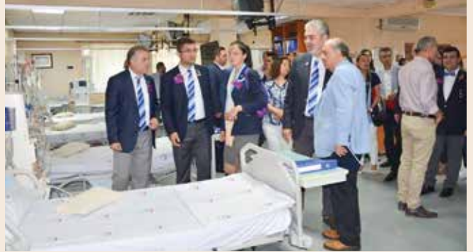
Akçakoca Rotary kulübünün Küresel Bağış ile gerçekleştirdiği Diyaliz ünitesi açıldı, Üstte iç mekan, altta binanın önünde birarada çekilmiş resim görülüyor.

Son olarak kürsüye gelen GDG Malik Aviral "Her zaman söylüyorum, yerel yönetimlerin bize destek olması çok önemlidir. Sayın Belediye Başkanım, Sayın Hastane yetkilileri böyle bir şeye açık olmasalar böyle bir hizmetin alınması sözkonusu olamazdı. Biz devamlı şunu söylüyoruz, lütfen yerel yönetimler bizlerin burada