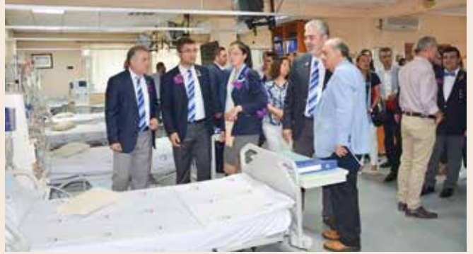
Akçakoca Rotary kulübünün Küresel Bağış ile gerçekleştirdiği Diyaliz ünitesi açıldı, Üstte iç mekan, altta binanın önünde birarada çekilmiş resim görülüyor.