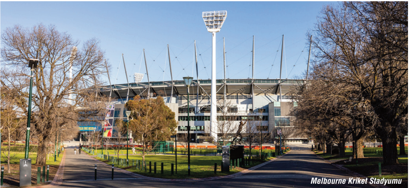
Melbourne Kriket Stadyumu