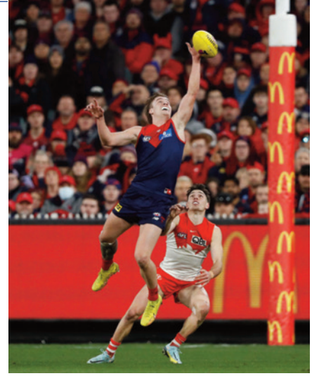
Melbourne Şeytanları 2022 yılı boyunca hareketliydi. AFL ikinci eleme rövanş maçı.

Motor sporlarınızı iki tekerlek üzerinde yapmayı tercih ediyorsanız, Avustralya Motosiklet Grand Prix'sinin yeri için manzaralı Phillip Adası'na gidin. Tamamen farklı bir şey için, binlerce küçük mavi penguenin gün batımında kumların üzerinden eve koştuğu Phillip Island Penguin Parade'e bakın.