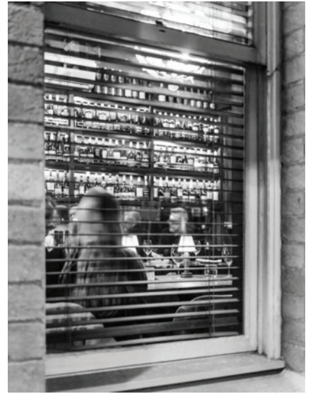
Üst Sıra: Melbourne Müzesi, İtalyan kafe Brunetti, Hosier Lane sokak sanatı Orta: Regent Theatre, Coombe Yarra Valley, Punch Lane Wine Bar & Restaurant Altta: Melbourne'da bir sokak çalgıcısı, Thai restoranı Cookie, National Gallery of Victoria